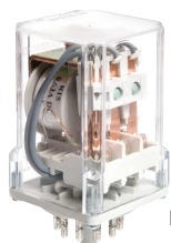
R15 - 3 CO