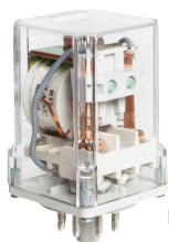
R15 - 2 CO