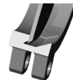
Уплотнение металл / металл